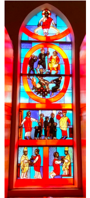
Pfarrkirche St. Laur Reichenhofen